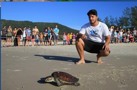
Actividades de celebración