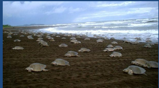
Fotografía de arribada tortuga golfina

Para ver detalles de actividades, siga el enlace: http://www.fisheries.noaa.gov/stories/a/species/turtles/index.html