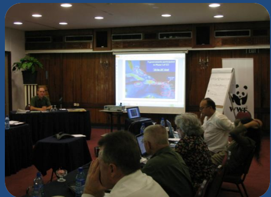
Reunión Anual CMA