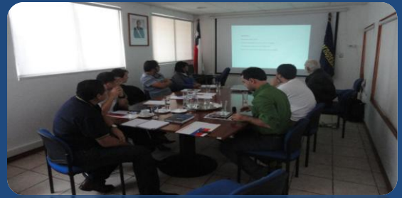
Reunión de la Mesa Regional, Mayo 2014

Uno de los hitos importantes que se debe destacar en el ultimo tiempo, es que el Gobierno Regional de Arica y Parinacota en el año 2011, financia el Programa de Conservación de Tortugas Marinas ejecutado por la Universidad Arturo Prat (Tortumar-Chile), estudio que sirve de base, para obtener la información técnica y científica con la cual la Mesa Regional de Tortugas se encuentra trabajando, con el fin de evaluar la posibilidad de poder establecer un Área Protegida. Lo anterior, otorgaría una figura de protección legal, tanto para la especie como para el sector de alimentación.