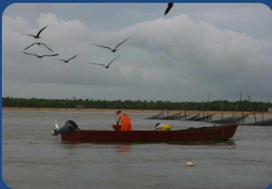
Pescadores en la desembocadura del Río Surinam, redes de pesca y de fondo playas de anidación de tortugas Baula y tortugas verde

Como algunos de los resultados de la reunión se creó un plan de trabajo de CMA que tiene un componente de tortugas marinas donde se contempla trabajar principalmente con CIT y WIDECAST en los temas del impacto del cambio climático en los hábitats de las tortugas y fomentar la creación de capacidades y el intercambio de información. Además, durante la visita a Surinam la secretaria PT de CIT también se reunió con autoridades de ambiente de Surinam para invitarlos a estudiar la posibilidad de iniciar el proceso de adhesión a CIT.