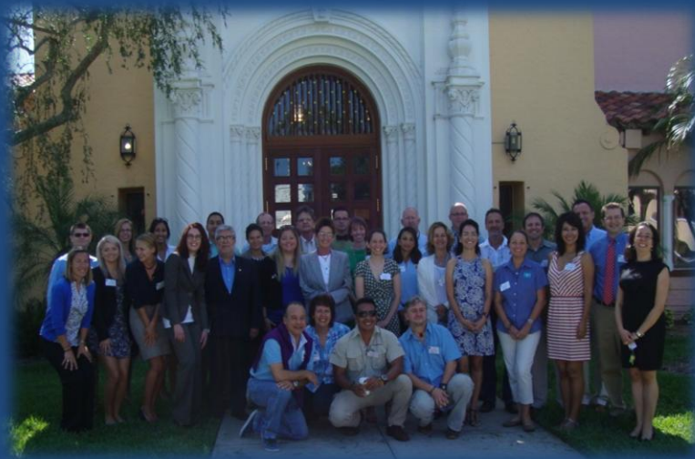
Fotografía de Grupo CCE7