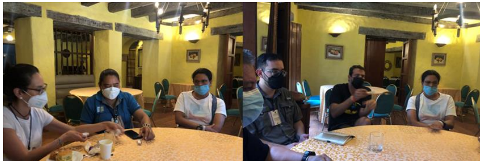
Secretaría de la CIT en reunión con representantes de Sea Turtle Conservancy, Red Panatortugas, delegado de la CIT y del Servicio Nacional Aeronaval de Panamá

El día 23 de marzo del 2023, la CIT sostuvo reunión introductoria con representantes de la sociedad civil y grupos organizados de la Red Panatortugas-Panamá, Sea Turtle Conservancy, junto con el Punto Focal Técnico de Panamá ante la CIT y la representante del Servicio Nacional Aeronaval de Panamá, donde se buscó el acercamiento de estas organizaciones con la Convención para fomentar la colaboración y en intercambio de información. También ofreció el espacio para reconocer el gran trabajo de estas organizaciones en la recolección de datos y su importante aporte en los Informes Anuales de país que dan cumplimiento a esta convención, así como también, reiterar la importancia de que se mantenga un trabajo mancomunado entre el gobierno, sector civil y ONG y autoridades de seguridad para garantizar la seguridad y el éxito de los resultados en los proyectos de conservación a nivel nacional en Panamá.