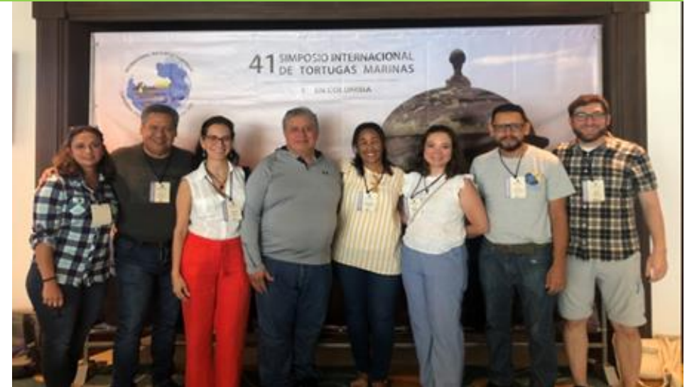
Foto arriba: Delegados de Estados Unidos, Ecuador, Panamá, Belize y Estados Unidos y la Secretaría de la CIT durante el Simposio Internacional de Tortugas Marinas en Cartagena, Colombia.

El ISTS41 brindó la oportunidad para realizar talleres y reuniones regionales con miembros de África, Mediterráneo, Oceanía, IOSEA, Retomala, Red Laud OPO y WIDECAS; capacitación de más de 650 personas en los 12 diferentes talleres realizados en el marco del simposio, y una hermosa experiencia para reconectar con toda la comunidad tortuguera después de 2 años de ausencia debido a la pandemia del COVID. La Secretaría de la CIT participó en el ISTS y en algunas reuniones regionales en el marco del mismo.