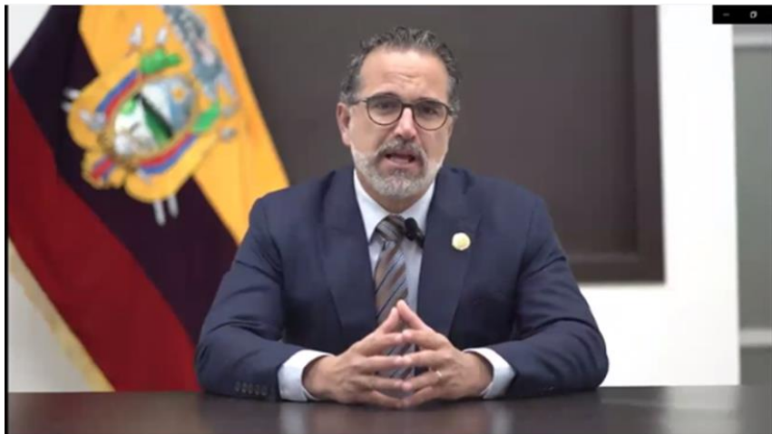
Participación virtual de la Presidencia de la Conferencia de las Partes de la CIT a cargo del S.E Gustavo Manrique Miranda, Ministro de Ambiente y Agua de Ecuador.

El Ministro de Medio Ambiente de Ecuador, D. Gustavo Manrique, quien se dirigió a los asistentes a la ceremonia a través de un video pregrabado, elogió a la CIT y al ACAP por su inquebrantable labor de conservación, afirmando que «ambas iniciativas han sido un ejemplo de cómo articular un trabajo coherente y eficaz para luchar contra uno de los retos más acuciantes a los que se enfrenta el mundo en la actualidad: la rápida pérdida de su biodiversidad.»