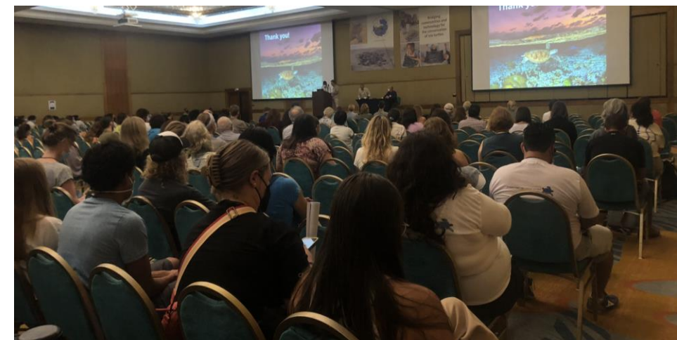
Foto de abajo: Imágenes de uno de las tantas interesantes presentaciones de proyectos y experiencias compartidas durante el ISTS41.