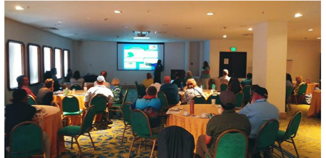
Foto Secretaría de la CIT, participa en reunion de WIDECAST en el marco del ISTS41.

CIT Participa en Reunión Anual de WIDECAST 2023: La Secretaria de CIT fue invitada como expositora en la Reunión Anual de WIDECAST que se llevó a cabo el 19 de Marzo de 2023 en el marco de ISTS 41. La CIT presentó un resumen de sus actividades, las nuevas resoluciones adoptadas en la 10ma Conferencia de las Partes y oportunidades de colaboración de los miembros de WIDECAST y CIT en temas como: Asesoría técnica para preparar las Resoluciones de CIT COP11-2024, apoyo de miembros de WIDECAST en promover la Convención para incrementar nuevos países partes, participación de WIDECAST como observador en las reuniones de la CIT, Coordinadores de WIDECAST en diferentes países, proveen información para sus países contribuyendo con el Reporte Anual de la CIT, contribución con información para documentos técnicos de la CIT.