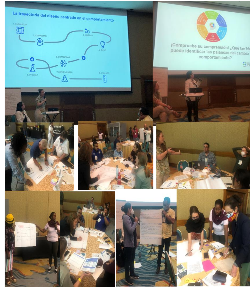
Fotos de las diferentes actividades realizadas por los participantes del taller, durante la sesión facilitada por el equipo de RARE.

2) Sesión especial: Cambio de comportamiento en la práctica para la conservación. Diseñado y facilitado por RARE Center for Behavior and Environment. La sesión brindó información básica de los principios de la ciencia del comportamiento con los que se pueden diseñar soluciones ambientales. Los participantes del taller trabajaron en equipos y se les entregó un folleto de trabajo (español e inglés) sobre la aplicación de las herramientas del diseño centrado en el comportamiento para promover la protección y conservación de las tortugas marinas. El contenido estaba dirigido a aquellos que trabajan activamente en el tema del tráfico y uso directo de tortugas marinas en América Central y del Sur en un esfuerzo por brindar el conocimiento y las herramientas necesarias para que los profesionales y las agencias adopten este enfoque de cambio de comportamiento en sus programas. Después de un trabajo práctico en equipo con las pautas del folleto, cada equipo presentó los resultados al plenario y las reflexiones y conclusiones finales de la sesión.