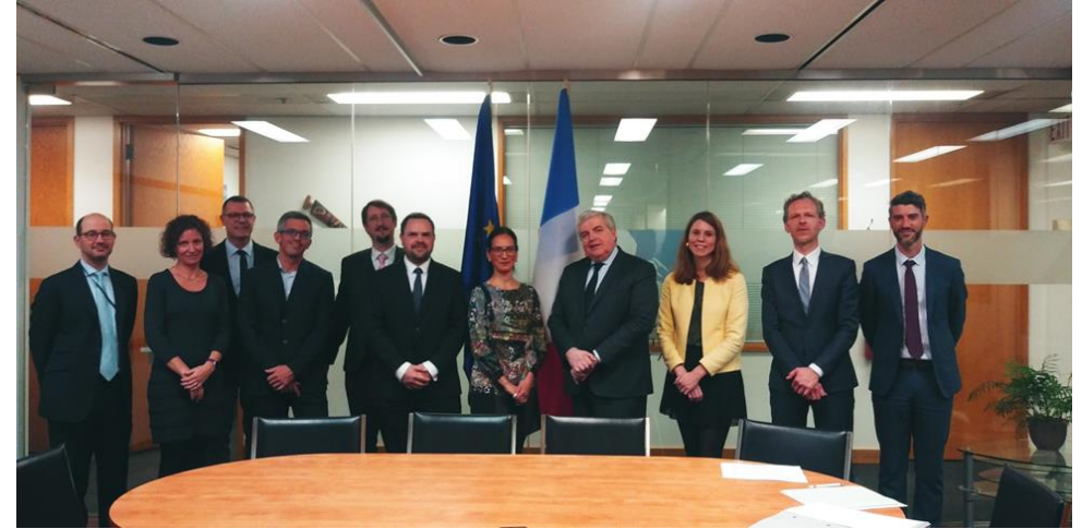
Foto 2: Ceremonia en el Consulado de Francia en Vancouver, Canadá. Participantes de la Agencia Francesa para la Conservación de la Biodiversidad, Ministerio de Transición Ecológica, personal del Consulado.

Durante la ceremonia participaron representantes de la Agencia Francesa para la Conservación de la Biodiversidad, Ministerio de Transición Ecológica y representantes de los territorios franceses.