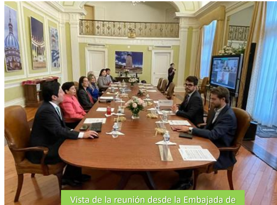
Vista de la reunión desde la Embajada de Ecuador en Washington, DC.