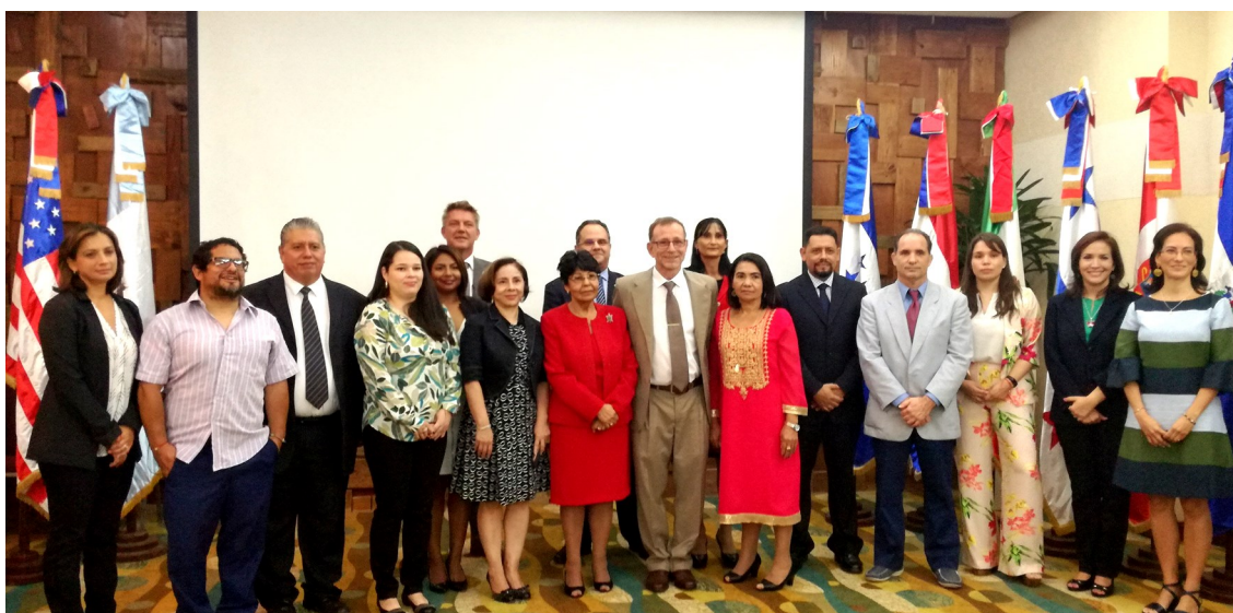
Delegados y Secretaria PT CIT en la 9a Conferencia de las Partes (COP9)

República Dominicana, anfitrión de la Novena Conferencia de las Partes (COP9) de la Convención Interamericana para la Protección y Conservación de las Tortugas marinas – CIT.