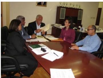
Reunión con Ministro de Ambiente República Dominicana