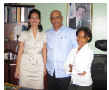
Reunión Con Director de CODOPESCA